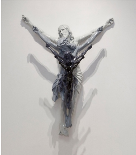
Carlos Aires Jesus Five , 2011 Plâtre, bois et peinture de carrosserie