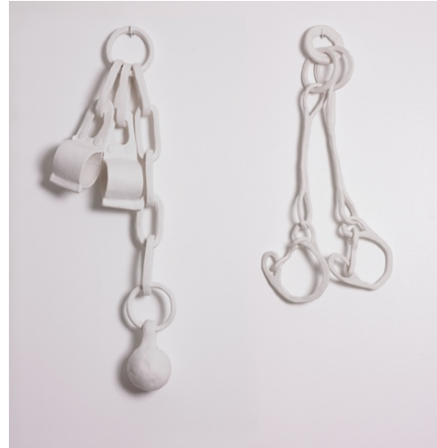
Rachel Labastie Entraves , 2009 Porcelaine