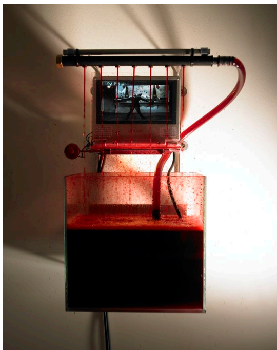
Johan Muyle Singin' in the rain , 2007 Structure métallique, détecteurs, composants électroniques, écran vidéo, lecteur dvd, câble, ampoule, valise aluminium