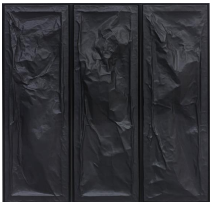
Underworks - Black Edit , 2008-2010 Résine moulée sur une toile en feuille d'aluminium, cadre de l'artiste 189,5 x 195 cm

Né en 1979 à Eaubonne. Vit et travaille à Paris.