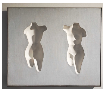
Sans Titre, 1965 Technique mixte 47,5 x 56 cm