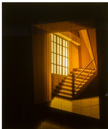
Tautologia, 2017 Plexiglass et scotch 65 x 55 cm

Né en 1982 à Camagüey (Cuba). Vit et travaille à La Havane (Cuba).