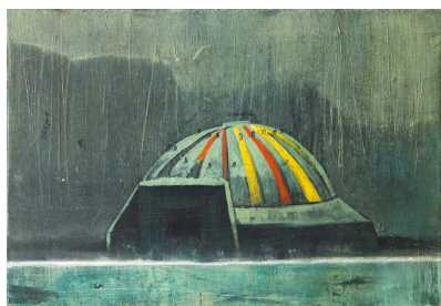
Circo (Serie Letargo), 2019 Huile sur toile 38 x 55 cm

Né en 1981 à Manzanillo (Cuba). Vit et travaille à la Havane.