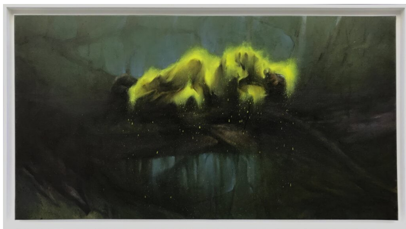
Sergey Kononov, Le Sommeil , 2017. Huile sur toile ; 71 x 126 cm.

Art & végétal Dada Pop art Ready Made Street art