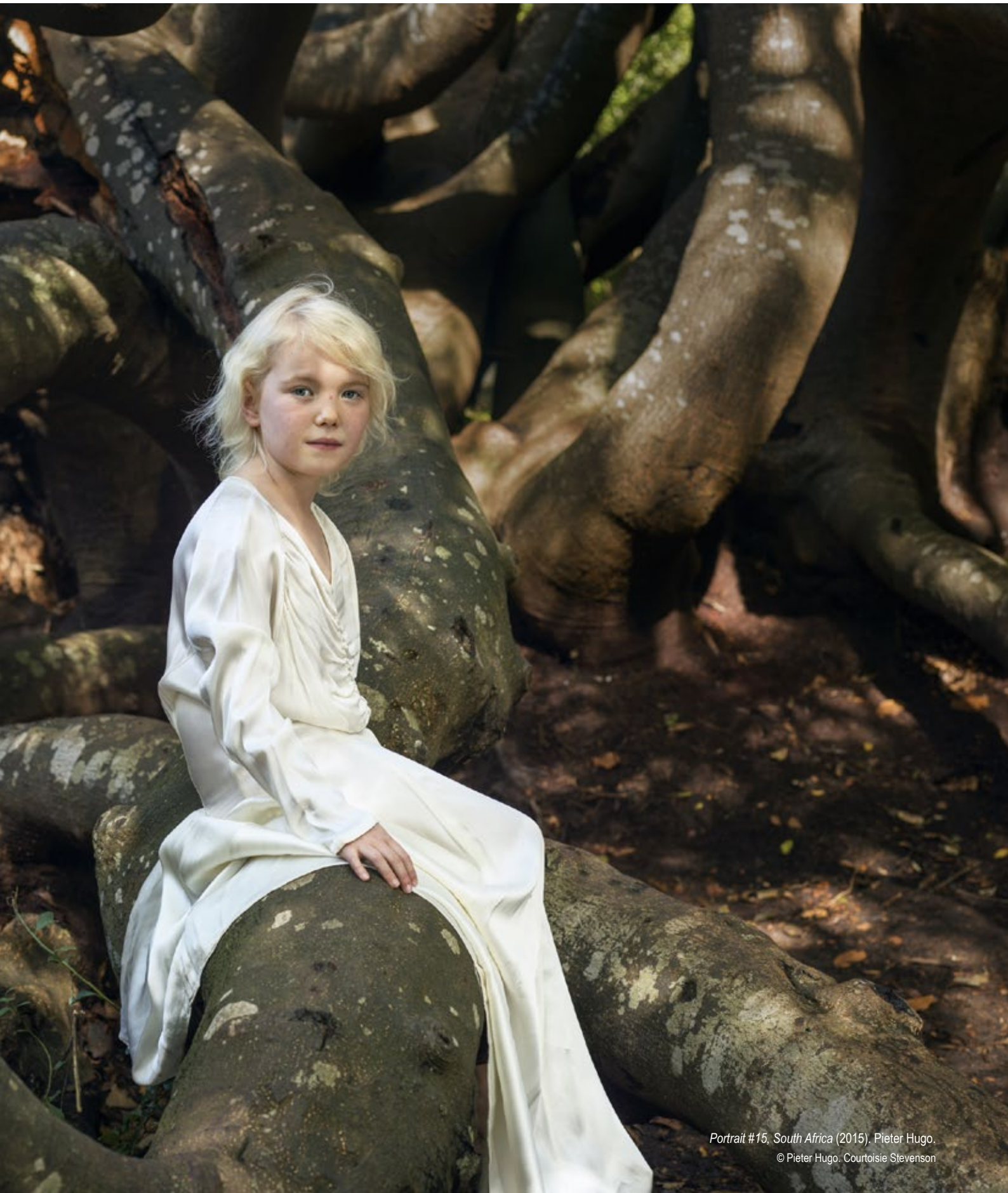
Portrait #15, South Africa (2015), Pieter Hugo.