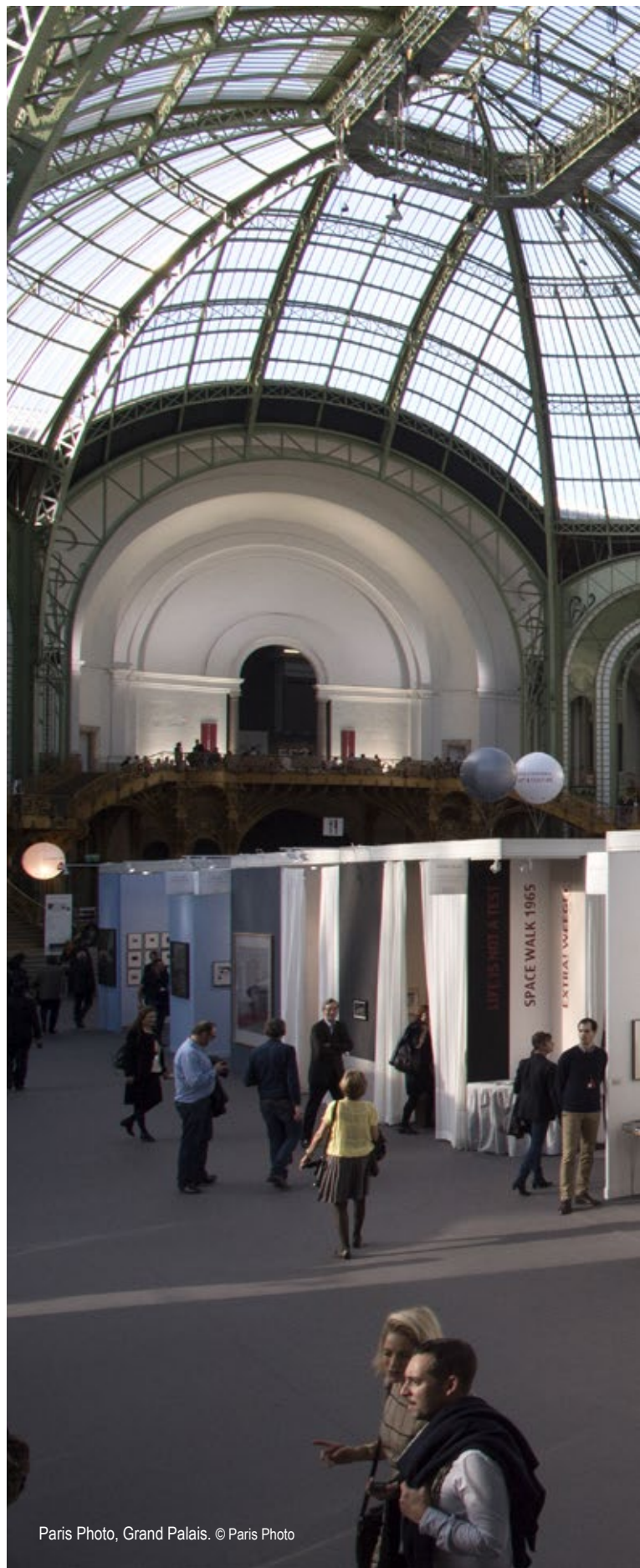
Paris Photo, Grand Palais.

27 rue Saint-Pierre, 60300 Senlis. www.fondationfrances.com