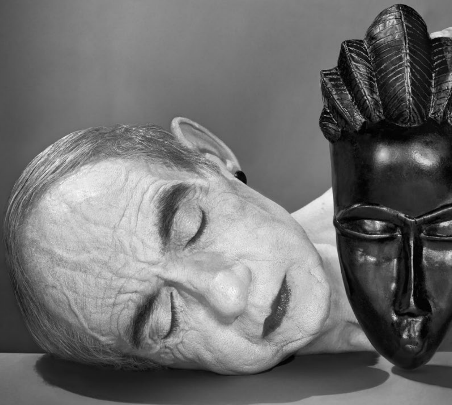
Looking for the Masters in Ricardo's Golden Shoes #17 (2016), Catherine Balet.