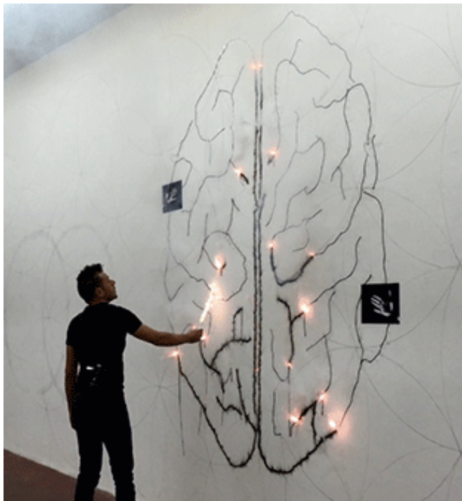
Zera, 2015 - Performance © Collection Francès